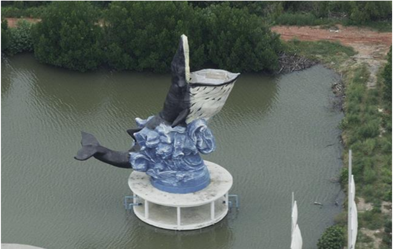
รูปปั้นวาฬรูปร่างใหญ่ของหน่วยงานหนึ่งใกล้ๆกับชายทะเล

ครับ รูปปั้นวาฬรูปร่างใหญ่ครับ น่าจะเป็นของหน่วยงานไหนไว้วันหลังจะหารายละเอียดมาดูกันครับ.