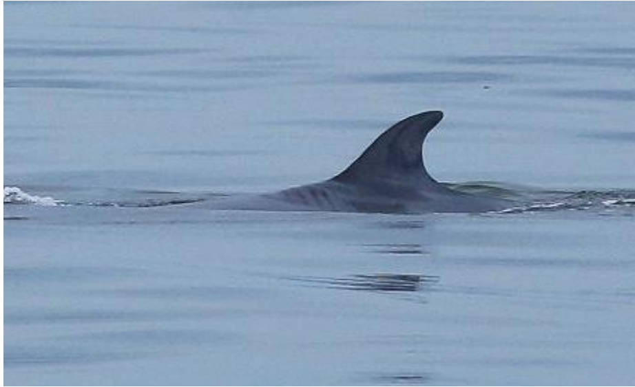
คำหนีของเจ้าชัดเจนบริเวณใกล้ศรีภวัง

การสำรวจทางอากาศวันนี้ของผมจบลงอย่างดีก็ด้วยความร่วมมือกันของคนที่ผมเรียกได้อย่างสนิทปากว่าเพื่อน ทั้งช่วยระบุตำแหน่ง, แจ้งระบุอัตลักษณ์ของแต่ละตัว, อำนวยความสะดวกให้ลูกน้องผมได้ไปเก็บภาพแห่งความสมบูรณ์ในอ่าวไทยของเรา ผมได้ความอึดใจ ทั้งมีรูปภาพ และ เห็นความอุดมสมบูรณ์ของอ่าวไทยเขาไปพร้อมๆกันในใจแอบนึกหวังเอาไว้ว่าเราจะสามารถเก็บความอุดมสมบูรณ์นี้ไว้ได้นานเท่านั้น