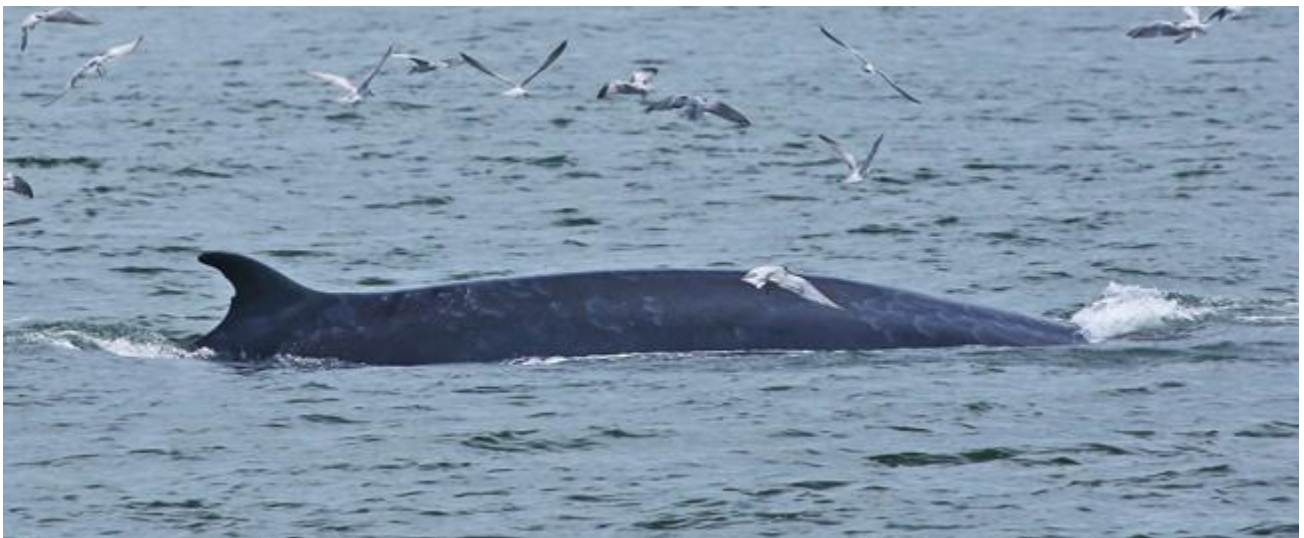
เจ้าสามมุข มาพร้อมกับลายข้างตัวแต่เหมือนน้อยกว่า