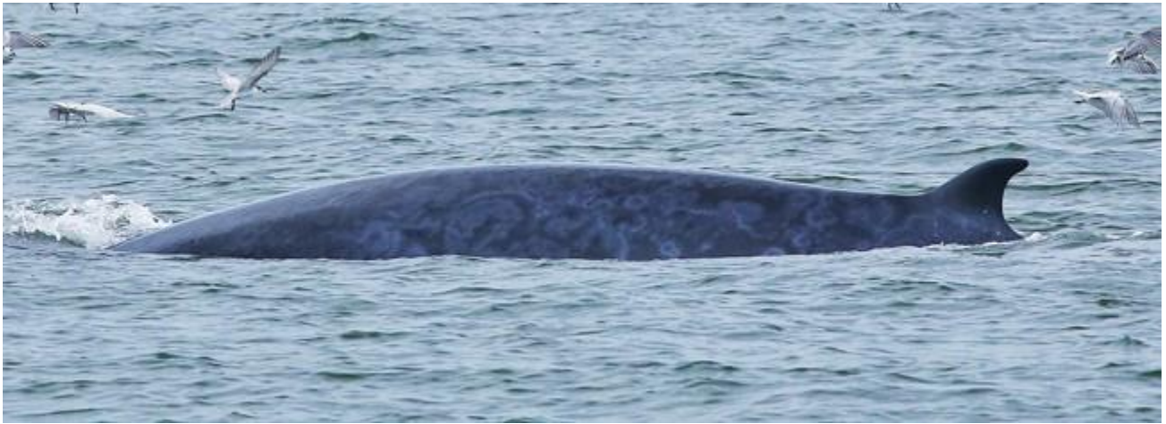
ลายที่ปรากฏบนตัวเจ้าพัทธยาขณะนี้