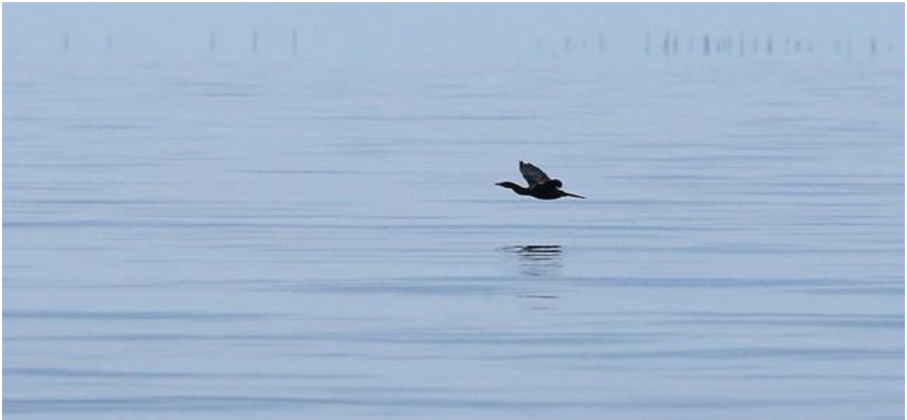
กาน้ำเล็กก็ออกร่อนเพื่อมองหาฝูงปลาในเช้าวันนั้น