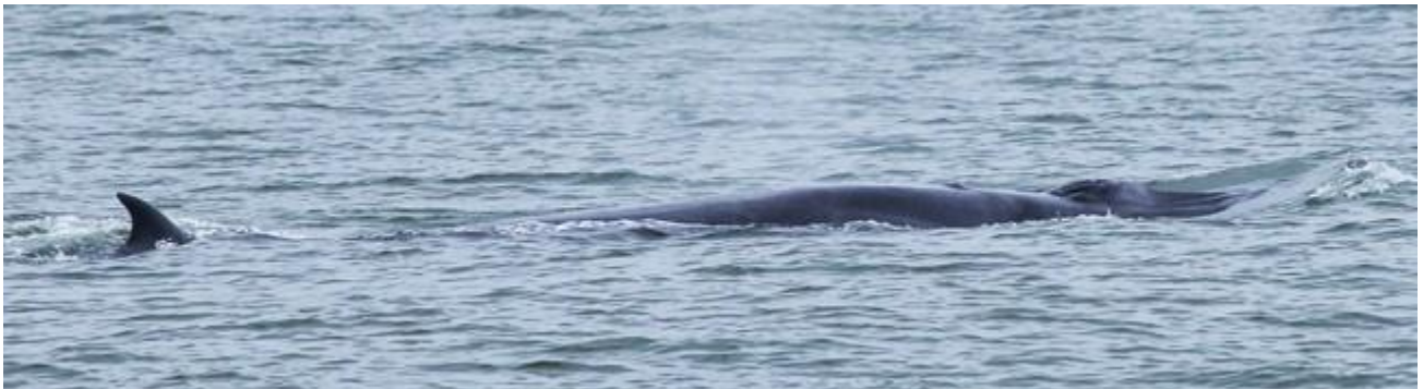
เจ้าแกร่ง สังเกตปุ่มเล็กๆที่บริเวณหลัง