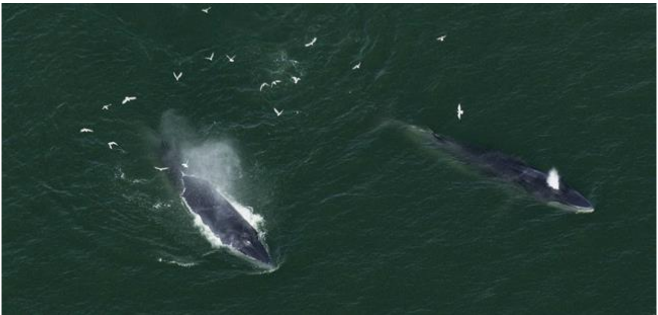
เพื่อนกัน หรือ คู่กัน หรือ ร่วมมือกัน ไม่ว่าจะเป็นอย่างใด ภาพก็ดูอบอุ่นเสมอ