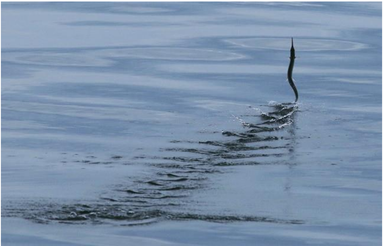
เจ้ากระตู่เหวที่ตกใจเสียงเรือแล้วออกพุงหนีไปอยู่หลายๆตัวในวันนั้น