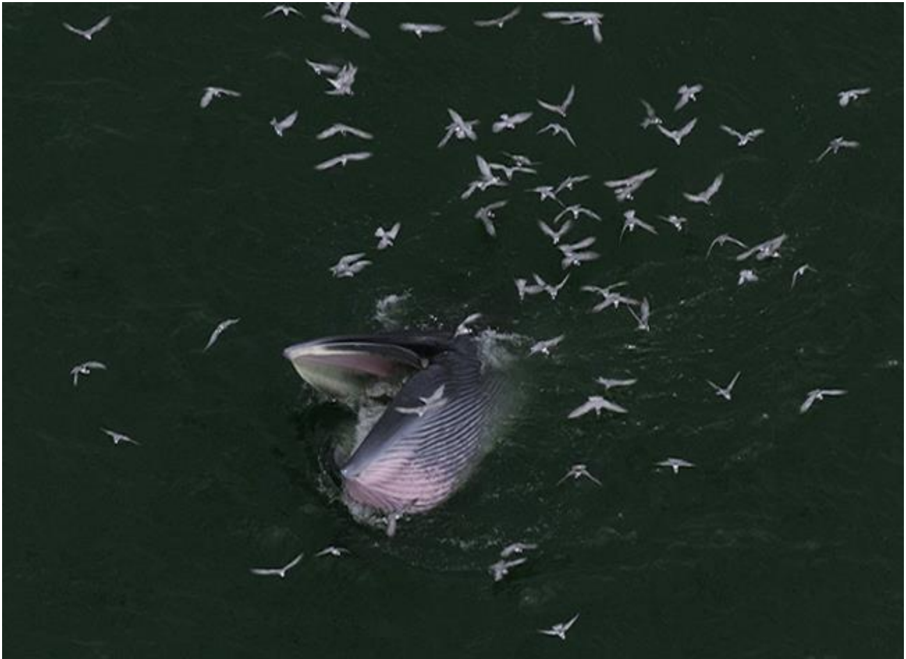
ฝูงนกที่ช่วยตกแต่งให้ภาพวาฬขึ้นกินปลากระตักบนพื้นน้ำสีเข้มให้สมบูรณ์ขึ้น