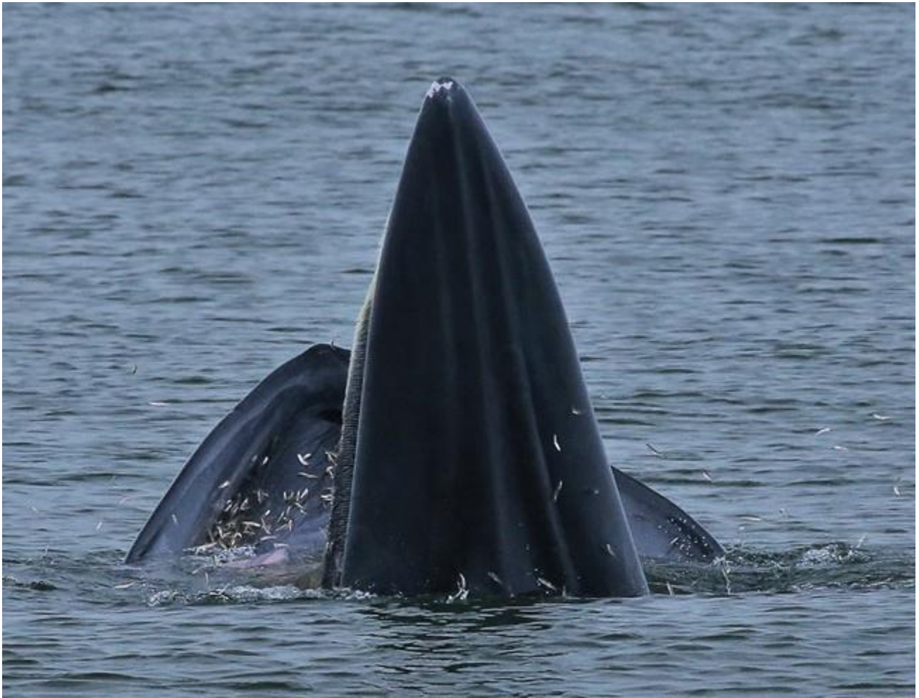
เจ้าสมหวังที่ห่างหายไปเหมือนกัน วันนั้นแยกหากินอยู่ตัวเดียว