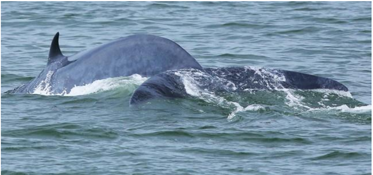
เจ้าพัทธยาที่ขณะนี้ลำตัวเริ่มมี TSD ขึ้นทั่วตัว