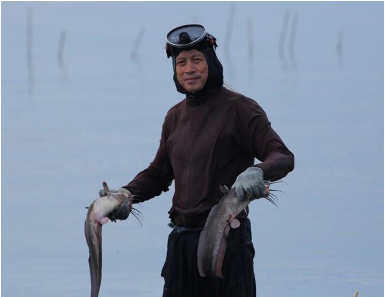
ชาวประมงกับปลาตุกทะเลที่ไม่ต้องบอกก็รู้ว่ามีความอุดมสมบูรณ์ขนาดไหน