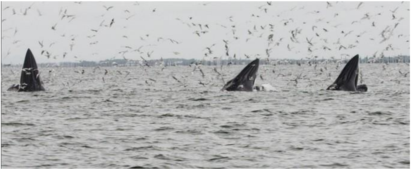
วาฬ 3 ตัว ที่หากินใกล้กันเมื่อจันทร์ที่ 23 ก.ย. 56

เมื่อวันจันทร์ที่ 23 เราก็ได้พบพวกเขาประมาณ 6 ตัวได้เห็นพฤติกรรมรวมฝูงแปลกๆ เราได้พบแม่ลูก (แม่วันสุขและลูกตัวใหม่เจ้าแสนสุข) เจ้าสุขใจ ซึ่งเป็นลูกแม่วันสุขแต่แยกหากินตั้งแต่ปีที่แล้วมากับเจ้าทองดี รวมทั้งเจ้าประจำผมเองกลับไม่ค่อยได้เจอเขา คือ เจ้าเมฆา ซึ่งรวมกลุ่มมาหากินร่วมกันบ่อยครั้งที่ขึ้นพร้อมๆกันทั้งสามตัว และ มีอีกตัวที่ว้ายเนิบๆแต่ไม่โผล่ให้เห็นเลยบอกไม่ได้ว่าตัวไหน.