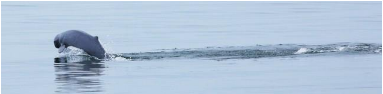
โลมาที่เจ้าทรายพลัดล้อมรอบเรืออยู่ 6-8 ตัว น่าจะมองหาตุกทะเลเหมือนกัน