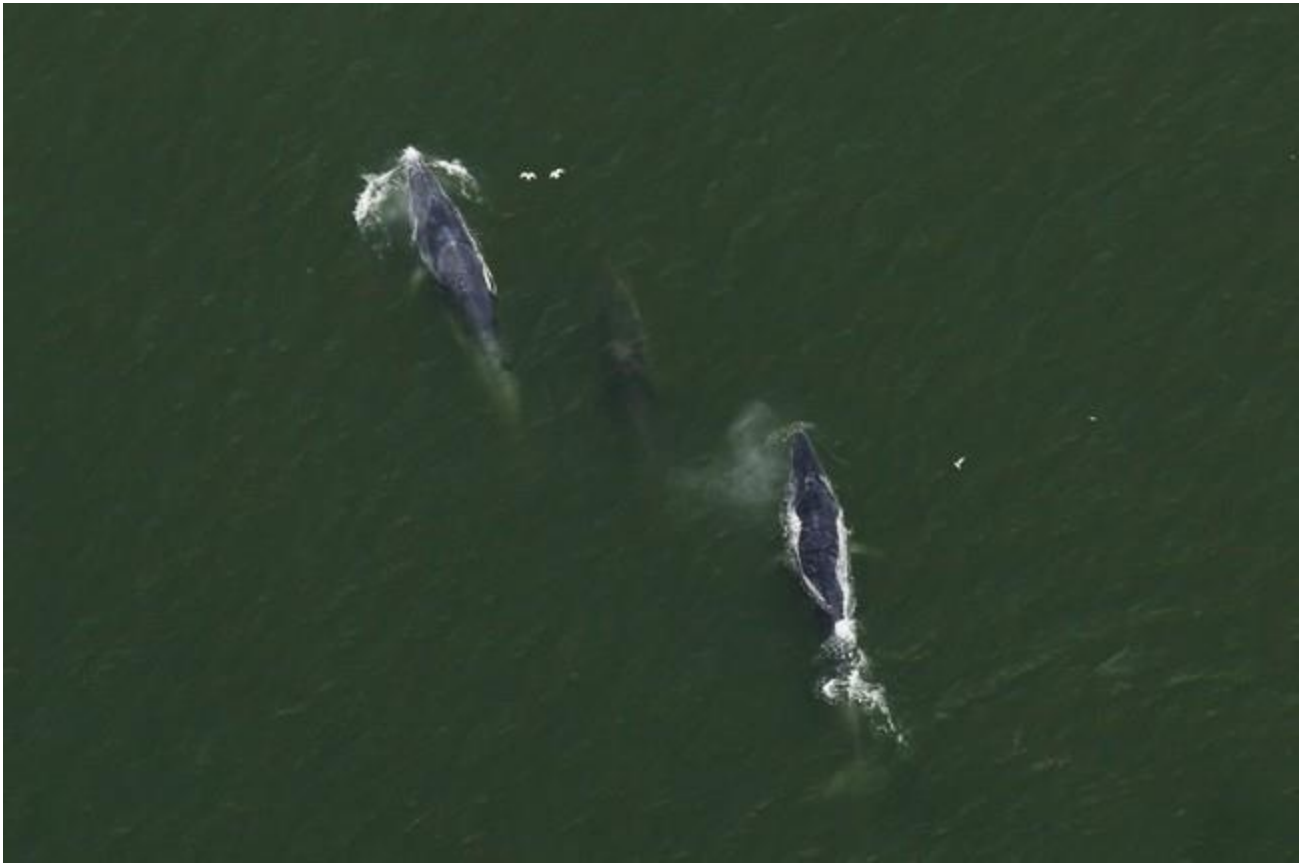
เจ้าชัดเจน,เจ้าบันเทิงและเจ้าสามमुख หากินอยู่ใกล้ๆกัน