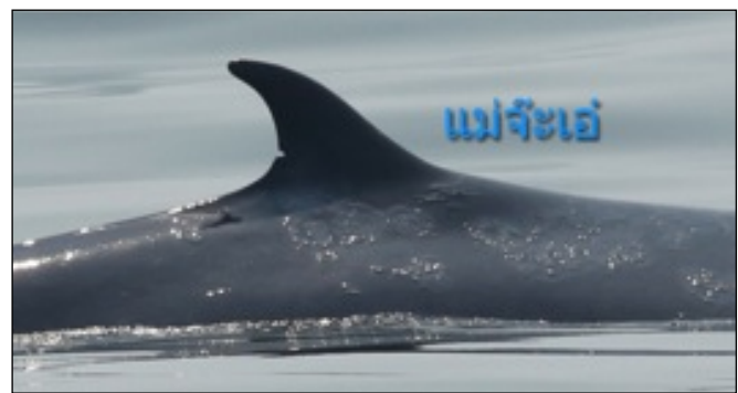
ครีบหลังที่มีตำหนิใกล้เคียงกันมาก ของ แม่สดใส และ แม่จ๊ะเอ๋