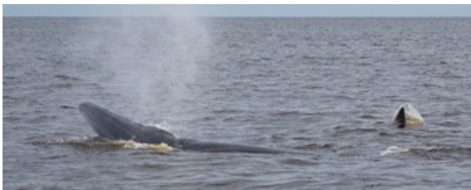
แม่พาฝันว่ายน้ำถอยหลัง

แม้ตอนที่แยกออกมาจากคู่แม่ลูกก็เพราะมีวาฬอีกตัว (แม่พาฝัน) ว่ายเข้าไปใกล้ เจ้าวาฬตัวนี้ก็รีบว่ายเข้ามาหา จนแม่พาฝันยังทำพฤติกรรมแปลกๆให้เราเห็นคือว่ายถอยหลังและดำลงพร้อมยกหางตึ้นน้ำนับเป็นครั้งแรกๆที่เราได้เห็นพฤติกรรมแบบนี้