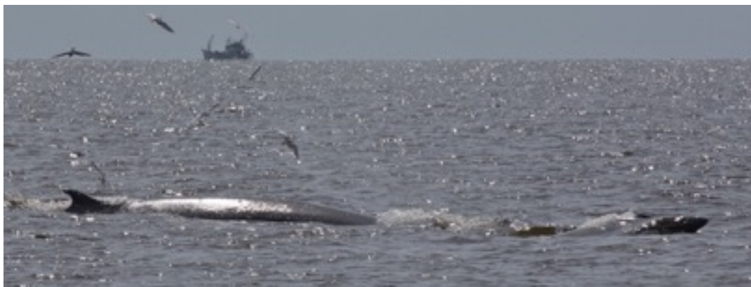
แม่เพชรกับรอยแผล (ซ้าย) และลูกน้อยของแม่กล้า (ขวา)

สักพักเราก็เริ่มรู้แล้วว่าที่ว่ายอยู่คู่แม่ลูกนี่คือแม่ใหม่ที่ทางศวทบ.ได้พบเมื่อเดือนที่แล้วสุดๆ ร้อนๆคือ “แม่กล้าและลูกน้อยที่ยังไม่ได้ตั้งชื่อ” แต่ที่ค่อนข้างจะทำให้ผมรู้สึกใจเสียและไม่ค่อยอยากยอมรับความจริง คือ เจ้าตัวที่ว่ายตามคู่นี้มาติดๆและบ่อยครั้งที่เห็นแทรกกระหว่างแม่กล้ากับลูกน้อยบ่อยๆซึ่งถ้าปกติเราก็อาจจะนึกว่าเป็นตัวผู้ที่พยายามเข้าแทรกเพื่อเข้าจับคู่ใหม่แต่ครั้งนี้จากการที่พวกเราได้ตามศึกษาพวกเขามาตลอดและค่อนข้างมั่นใจในลักษณะของครีบหลังที่ปรากฏให้เห็นและรอยแผลข้างตัวในตำแหน่งที่เราจับจ้องอยู่เพื่อยืนยันเพิ่มเติมจากการดูครีบหลังเพื่อเพิ่มความมั่นใจจากการสะสมประสบการณ์จากการทำ Photo ID ที่เราตามต่อเนื่องมาตลอด พวกเราทุกคนก็ลงความเห็นได้เหมือนกันว่า วาฬตัวที่ว่ายมาด้วยกันกับแม่กล้าและลูก เป็น ... “แม่เพชร” ใช้ครีบ..เป็นวาฬเพศเมียเหมือนแม่กล้านั้นแหละครับ