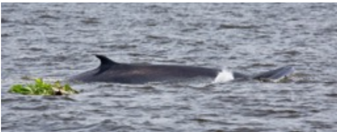
แม่วันสุข และ เจ้ามีสุข

วันนี้เราสำรวจพบวาฬ9ตัวแต่ถ่ายได้ไม่ครบทุกตัว ระยะเวลาไม่คอยโผล่ปากบ่อยๆเหมือนปีก่อนๆยังทำให้การระบุตัวตนของวาฬต้องดูเอาจากครีบหลังเป็นหลักใหญ่