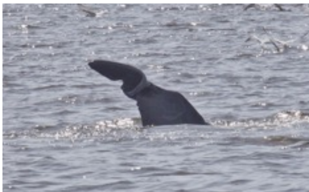
เข้าใจว่าเป็น หางแม่เพชร

... หรือมันอาจจะแค่ไม่อยากอยู่ตัวเดียวในช่วงนี้