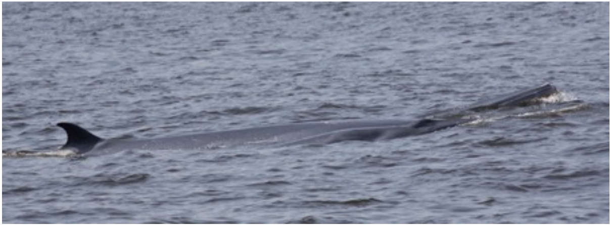
ครีบลหลังแม่กลา (ซ้าย) ปากแม่เพชร (ขวา) ลูกแม่กลา (กลาง)

ภาพแม่วาฬสองตัวว่ายไปด้วยกันและคลอเคลียไปกับเจ้าตัวเล็กตัวเดียวนั้นทำให้ผมอดคิดไม่ได้ว่าเมื่อแม่เพชรซึ่งผมคิดว่าอาจจะเสียลูกของเธอไปแล้ว