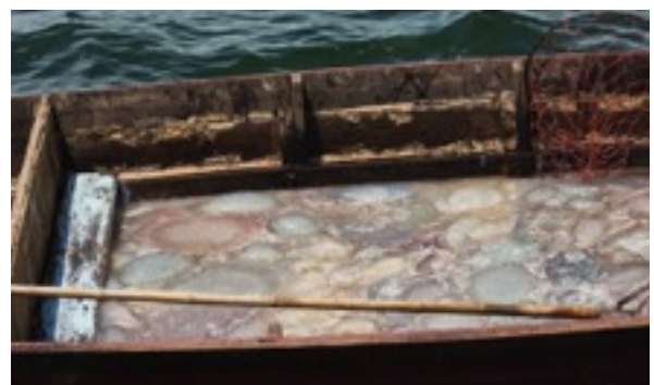
กองทัพแมงกะพรุน

วาฬที่พบในวันที่ 27 ก.ย. 2559 รวมทั้งสิ้น 9 ตัว