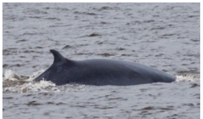
แม่เพชรกับรอยข้างลำตัว

วันนี้เรายังไม่รู้อะไรเพิ่มเติมเท่าไร แต่ผมหวังว่าถ้าเราพยายามมากพอ เราคนไทยจะได้เรียนรู้เพื่อให้เข้าใจ “วาฬไทย” ของเราฝูงนี้ให้ได้มากขึ้นทัดเทียมกับนักวิชาการในประเทศอื่นๆ ที่เขาศึกษาวาฬกันทั่วโลก ให้เราได้สามารถมีข้อมูลและหลักความรู้ที่สามารถใช้เป็นแหล่งเรียนรู้ได้ทัดเทียมกับประเทศอื่นๆ เช่นกันครับ