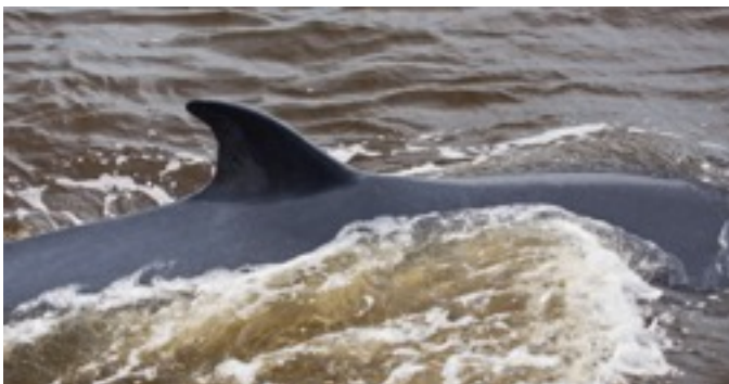
เจ้าตึก มาหาเรา และ ทีมศวทบ.ข้างๆ เรือ