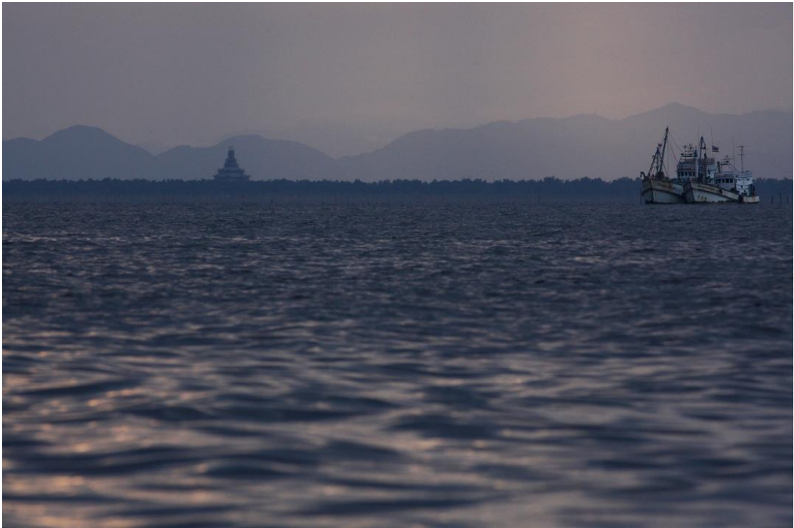
พักผ่อนเย็นกับสีทองเรื่อๆแถบบางตะบูน

มองออกไปเพื่อหาวาฬให้เรา ซึ่งครั้งแรกๆในปีแรกนั้นเป็นเหมือนเพียงนักท่องเที่ยวที่แค่อยากมาดูวาฬ กลายเป็น การมองหาวาฬด้วยความร่วมมือร่วมใจกันเพื่อเป็นการสำรวจจากในเรือวันนี้อย่างน้อยก็เพิ่มขึ้นมาอีก 3 – 4 คนครับ ที่เพิ่งมองออกไปอย่างเอาจริงเอาจังเพื่อจะมองเห็น, ถ่ายรูป และทำบันทึกไว้ให้เป็นสถิติเพื่อการศึกษาต่อไป. สำหรับผมวันนี้ถึงจะไม่มีวาฬให้เห็น แต่ได้เห็นความก้าวหน้า, ความร่วมมือเล็กๆบางอย่างที่ค่อยๆ ก่อตัวขึ้น..ถึงจะไม่ยิ่งใหญ่แต่ก็ไม่เล็กเกินกว่าที่จะให้เรางัยมึ่มๆให้กับความหวังบางอย่างได้ครับ.