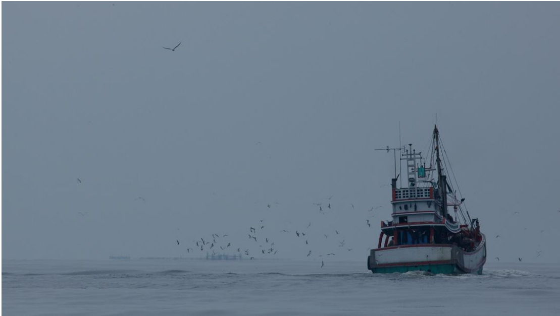
ฟ้าหม่นๆกับทะเลเรียบๆ

สัตว์ทะเลหายาก มีคุณหนึ่งและคุณขาว,คุณตอง ก็มาออกเรือเพื่อทำสำรวจวาฬประจำเดือน แต่ก็ไม่มีวีแววของพวกเขาเลยทั้งสองวัน และ ในวันพุธและพฤหัสบดี ก็ย้ายไปดูแถบบางปะกง ก็ได้ข่าวว่าไม่มีวีแววของพวกเขาเลยทั้งที่ฝูงก็ออกทะเลไปเพื่อวัดสถานะน้ำทะเลก็บอกว่าได้ไม่เห็นเลย