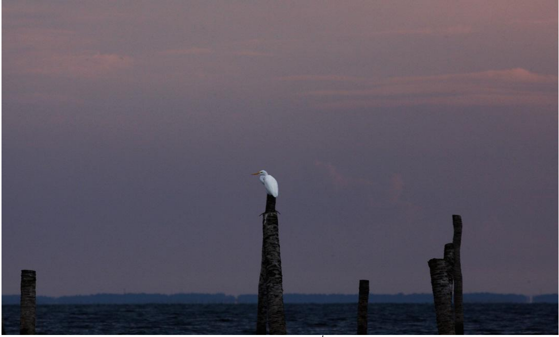
ยามเย็นกับกระยางที่หัวเสา