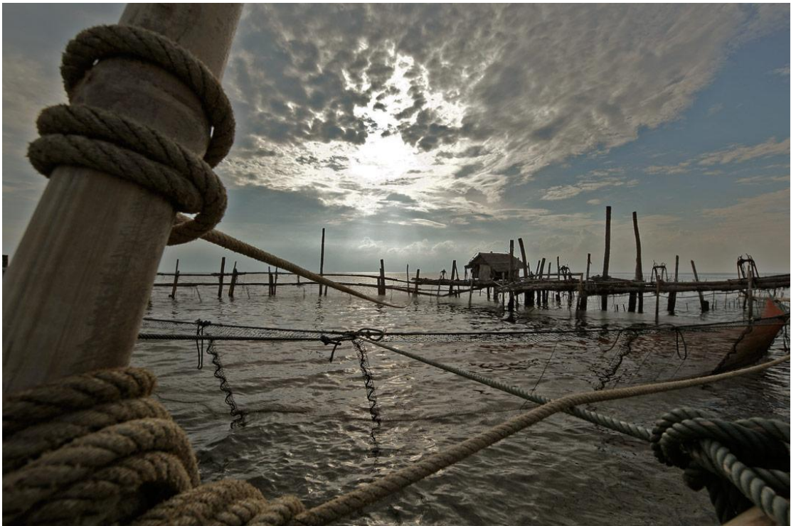
โป๊ะแถวๆบางตะนูน(385)