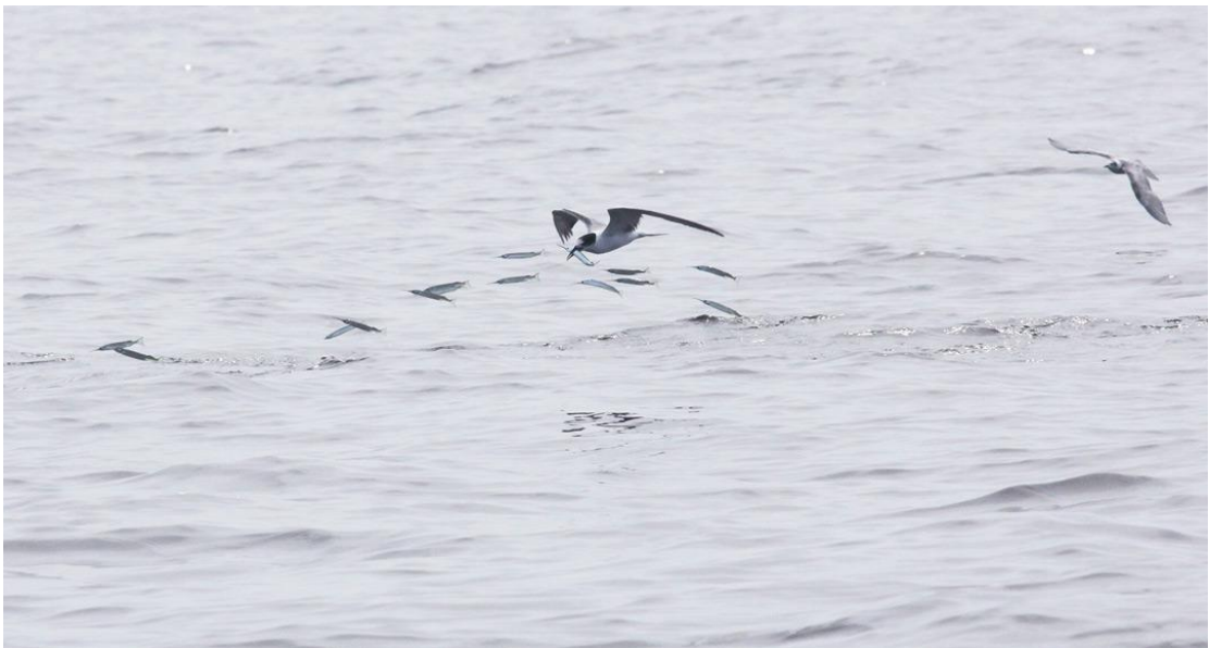
นกนางนวลโฉบเหยื่อที่ขึ้นอยู่ทั่วไป

ต่างๆเหล่านี้ครับ...นี่ถือเป็น คำถามพื้นฐานเอาหลายๆที่จนปานนี้เรายังไม่ได้คำตอบเหล่านี้ได้เลยสัก นิด. อย่างในขณะที่เวลาก็เข้าไปบ่ายสามโมง แล้ว เราเล่นเรือไปตามความคุ้นเคย ความคาดหวัง น่าจะเป็น..ไปถึงเกือบ ทำเงินแล้วและวกกลับมาทางเกือบๆแหลมผักเบี้ยแล้ว ยังคงไร้ที่แว้วพวก เขาโดยสิ้นเชิง. ทฤษฎีความคาดเดาของผมนั้นก็ออกมาเสนอหน้าว่า พวกเขา น่าจะลงไปหากินลงไปทาง อ่าวไทยตอนกลางหรือทางใต้มากขึ้นแล้วมั้ง น่าจะเป็นแหลมผักเบี้ย...หรือ บ่อนอก หรือ เอ..อาจไป ทางเขมรแล้ว มั้ง..อะไรก็เป็นไปได้ต่างๆ นานาครับ..ใช่ครับ..ในใจผมคิด...อนิจจาการ สํารวจและ การศึกษาวาฬไทยของเราครับ....ตั้งแต่ปีที่แล้วจนถึงนาที่นี้ การศึกษาและสํารวจวาฬในเมืองไทยยัง ใช้วิธีมาตรฐานแบบเดิมอยู่ครับ คือ มาตราฐานแห่งการตั้งสมมุติฐาน หรือถ้าจะให้เรียก แบบ บ้านๆ ก็คือ เดาๆเอาแหละครับ. ถ้าจะมีดีขึ้นในส่วนของผมก็คือ ผมได้มาพบและรู้จักเพื่อนๆที่ทำงาน โดยตรงหรือทางอ้อมที่ทำหรือชอบปลาวาฬเพิ่มขึ้น ถึงจะไม่ได้ทำเต็มเวลาแต่ก็ทุ่มเทมากที่สุดที่ สถานการณ์ปัจจุบันจะอำนวยให้ จำนวนคนแม้จะยังไม่มากนักแต่ก็เพิ่มขึ้นเรื่อยๆครับ และ สำหรับ ผมทำไป ทีละเล็กทีละน้อย ดีกว่าพุดๆแล้วไม่ลงมือทำอะไรเอาซะเลยครับ.