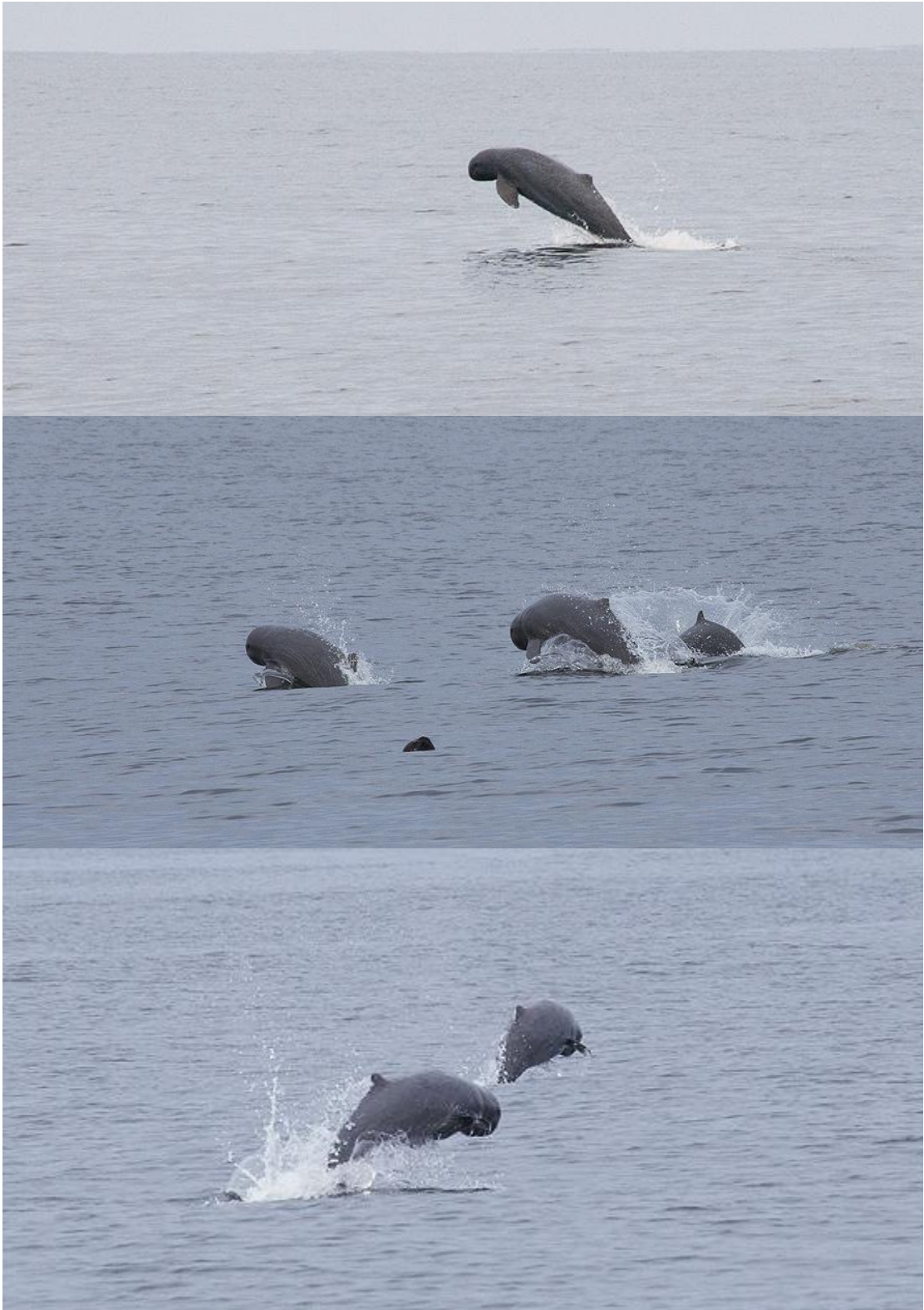
ฝูงโลมา 6 – 8 ตัว บริเวณโป๊ะจับปลาแถบบางตะบูน (3831,382)

คงเป็นเพราะธรรมชาติก็คงไม่ใจร้ายเกินไปกับเรานะครับที่ได้ส่งฝูงโลมานี้มาให้เราได้เห็นและ เพลิดเพลินกันไปได้อีกทั้งชั่วโมง หลังจากการพยายามตามหา พี่วาฬไทย ของเรากันทั้งวันซึ่งก็คงได้ ข้อสรุปว่า วันนี้ไม่มีขึ้นในแถบย่านนี้ เพราะจากสายตาของคนหนึ่งคน(พี่จ่าบุญ)ที่เคยเป็นคนเดียวที่