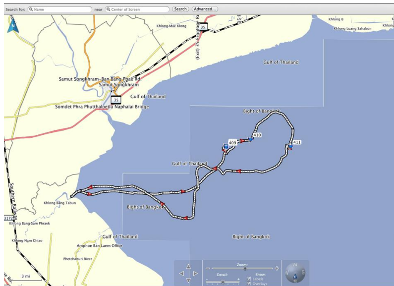
พื้นที่สำรวจ 14 มค. 56 บางตะบูนถึงสมุทสาคร

เมื่อนึกถึงอาณาบริเวณที่ แม่ก้นยาและลูก ได้ออกกว่ายน้ำเพื่อหากินและมีชีวิตอยู่ ในช่วงที่ได้พบเห็นของสองวันที่ต่างกันในวันอาทิตย์ และ ยังเป็นเฉพาะการติดตามที่เกิดขึ้นในเวลาเพียง 4-5 ชั่วโมงต่อวันเท่านั้นเรายังรู้สึกได้ถึงความต้องการพื้นที่ในการมีชีวิตที่เป็นปกติสุขของเขา การศึกษาใดใดก็ตามที่จะเกิดขึ้นน่าจะจะได้คำตอบที่ถูกต้องและแท้จริงก็ต่อเมื่อ ได้ศึกษาเขาในสภาพแวดล้อมที่แท้จริงเท่านั้น และ เช่นเดียวกับความบันเทิงที่แท้จริง ก็สามารถเกิดขึ้นได้อย่างใบริสุทธิต่อเมื่อได้เห็นพฤติกรรมที่เกิดตามธรรมชาติของเขาเท่านั้น เมื่อผมออกเรือเพื่อสำรวจหาพวกเขาทุกครั้งการได้มองออกไปนอกเรือร่วมกับคนอื่นๆเพื่อมองหาพวกเขา เจอบ้าง ไม่เจอบ้างก็ทำให้ผมมีความสุขสนุกสนานทุกครั้ง ในอิสระภาพของเขา