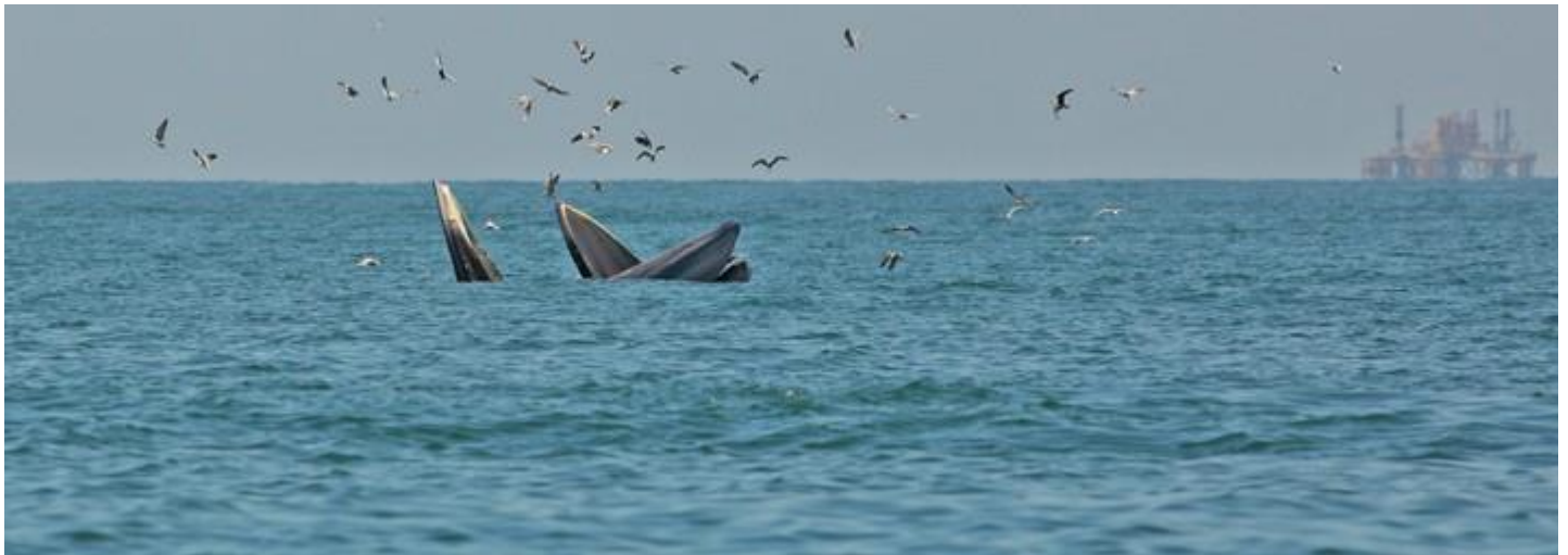
วาฬแม่ลูกที่เห็นตั้งแต่ไกลเมื่อมุ่งมาทางแท่นน้ำมันบางแก้ว

และก็แปลกแทบทุกครั้งก็เห็นไปทางหัวเรือแทบทุกครั้ง แต่น้อยครั้งมากที่พวกเราจะเป็นคนเห็น..ไม่ว่าเราจะพยายามอย่างไรก็หะ..อีกทั้งรอยยิ้มของพี่เขาอีกที่ผมไม่แน่ใจว่า เป็นรอยยิ้มที่แสนจะแสดงถึงการมีความสุขซึ่งผมไม่รู้ว่ ความสุขนั้นคือ..การได้เห็นวาฬที่โผล่มาทำให้ภารกิจการพาคนมาดูวาฬสำเร็จไป หรือ การได้เห็นวาฬที่โผล่มาแล้วดีใจที่พวกมันยังหากินอยู่ในผืนน้ำแห่งนี้... อันทำให้สามารถคิดต่อไปอีกได้ว่า การอนุรักษ์ที่ดีที่สุดนั้น คงต้องมาจากคนที่เป็นคนใช้ประโยชน์กับสิ่งๆ นั้น และเป็นคนในพื้นที่นั้นๆ และถ้าเขาเข้าใจและหวงแหน, รักในสิ่งนั้นแล้วเพิ่มความรู้ที่ถูกต้องเข้าไป ก็จะทำให้การอนุรักษ์นั้นสำเร็จลุล่วงไปได้และยังประโยชน์ร่วมกันได้ของทั้งสองชีวิตให้บรรจบเข้ามาอยู่เป็นชีวิตเดียวกัน และเมื่อใดที่เป็นเช่นนั้น..คำว่าอนุรักษ์ก็คงไม่ต้องมีใครมาคิดว่าต้องมีแคมเปญการรณรงค์เพื่อปกป้องอะไรอีกแล้ว..อยากให้มีวันนั้นจังเลยครับ. (พิกัด 429 – 434)