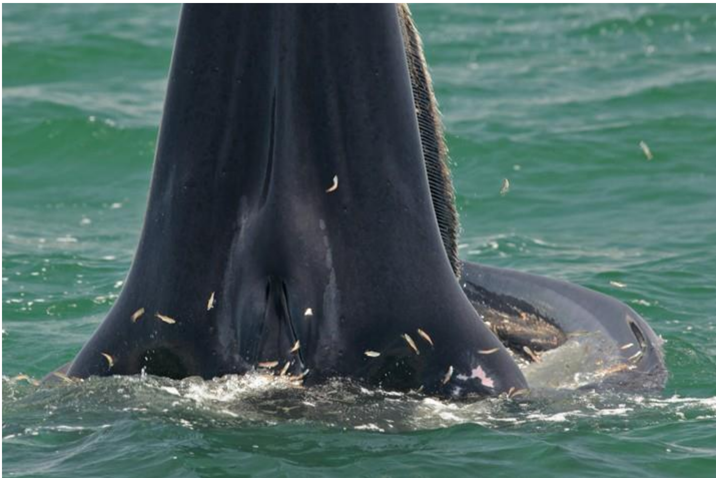
เจ้าบั้นเทิงขณะขึ้นสูบเหยื่อ มองเห็นจุดที่ใช้อ้างอิงอัตลักษณ์ของเขาได้ชัดเจน

กระทำนี้เป็นเพราะอนุรักษ์ เพราะรักและห่วงแหนเอง หรือเป็นเพราะรักพวกเขาไว้เพื่อเราจะได้มีประโยชน์ร่วมกัน ซึ่งไม่ว่าจะเป็นอย่างไรในทั้งสองอย่าง ก็คงสามารถตอบคำถามที่ผมมักจะตั้งคำถามนี้ไว้ในใจเสมอว่า “why save whales”