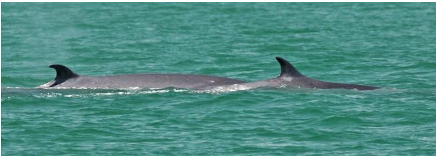
แม่กันยาและเจ้ามารวย ในวันที่หากินและแหวกว่ายอยู่ในน่านน้ำเดิมมาตั้งแต่ต้นปี

ในขณะที่เรากำลังติดตามเจ้าแม่ลูกคูนี้อยู่ พี่ธัญก็ชี้ให้เห็นวาฬอีกตัวหนึ่งที่โผล่มาทางด้านที่เราวิ่งผ่านมาแล้ว อยู่ไกลๆ หากินแยกไปอยู่ตัวเดียว ซึ่งภายหลังถึงรู้ว่าเป็นเจ้าบันเทิง