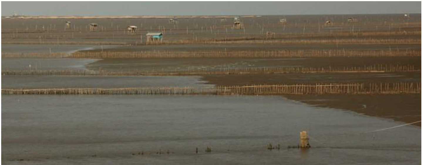
ฟาร์มหอยแครงบริเวณบางตะนูนแถบบ้านที่จำรูญถ่ายบนสะพานยามเย็น

สรุป พบวาฬแม่ลูก 1 คู่ (แม่กินยาและเจ้ามารวย), เจ้าบันเทิงและ ระนุไม่ได้อีก 1 ตัว(ถ่ายรูปได้) รวมเป็นทั้งหมด 4 ตัว