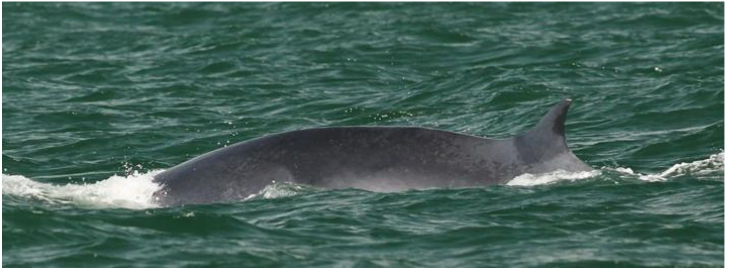
วาฬที่ว่ายอยู่ตัวเดียวใกล้บางตะนูน สังเกตมีรอยเหมือนถลอกบนครีหลัง