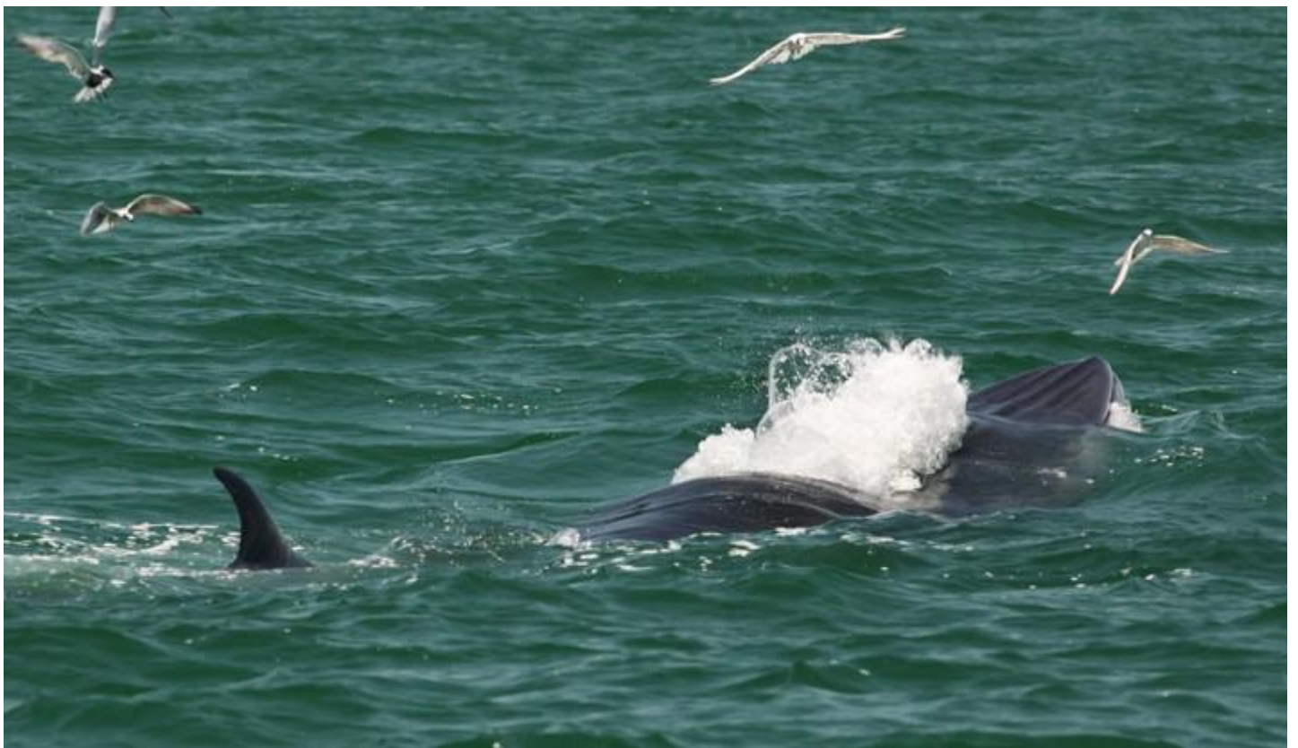
เจ้ามันเทิงกับจุดอ้างอิงอัตลักษณ์ของเขาค่อนข้างชัดเจนง่ายต่อการสังเกต ทั้งลายขอบปากและข้างตาขวา แม้ดำน้ำไปยังมองเห็นได้ชัดเจน