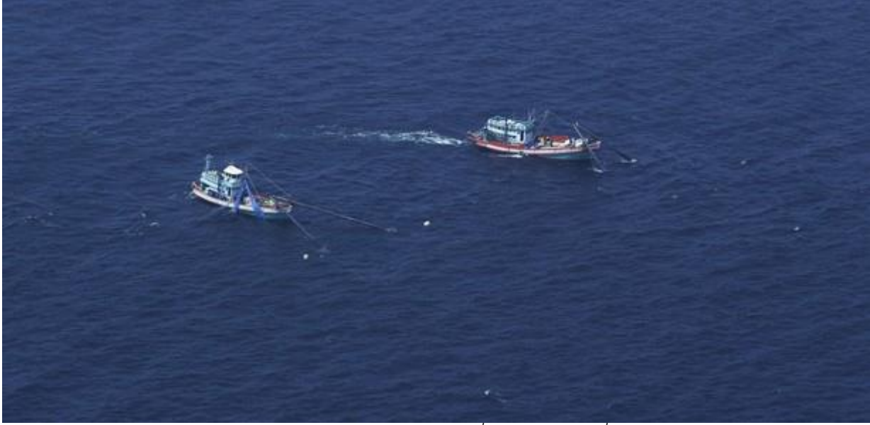
เรืออวนรุนหลายลำในบริเวณเพชรบุรีที่ออกทำงานแม้คลื่นลมจัด