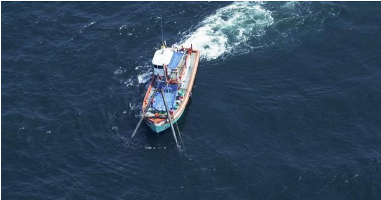
หนึ่งในหมู่เรืออวนรุนที่กำลังขมกเขม่นกับการทำประมงของเขา

มองหาไปเรื่อยๆ ท่ามกลางคลื่นหัวแตกที่ทำเอาชะงักทุกครั้งอย่างมีความหวัง. เวลาผ่านไปเราบินจากบริเวณแหลมผักเบี้ยแล้วผมลองขอให้พีทบินขนานกับแนวฝั่งสมุทรสงครามแต่ออกมาทางลึกๆที่เราเคยเจอ สองแม่ลูกหากินคราวก่อนด้วยความเชื่อว่าวาฬอาจจะมาหากินไกลออกมา ขณะนั้นก็เกือบจะสองชั่วโมงแล้วที่เราบินมา และได้แต่มองลงไปบนผืนน้ำที่มีคลื่นหัวแตกเต็มไปหมด