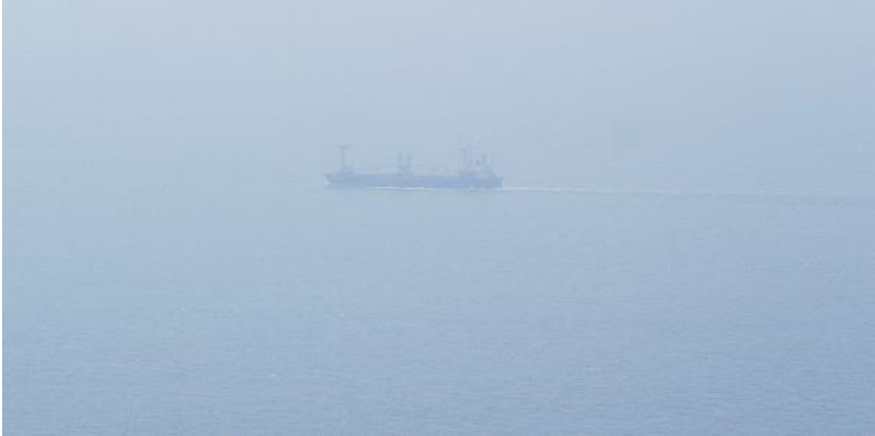
สภาพหมอกแดดที่หนาที่บพร้อมลมที่แรงในช่วงเช้าวันที่ 25ตค.56

เมื่อเราบินขึ้นมาจากสนามบิน best ocean ทันทีที่มองออกไปในทะเลผมก็เห็นสภาพอากาศที่ไม่เป็นใจในการออกสำรวจเลยทันที