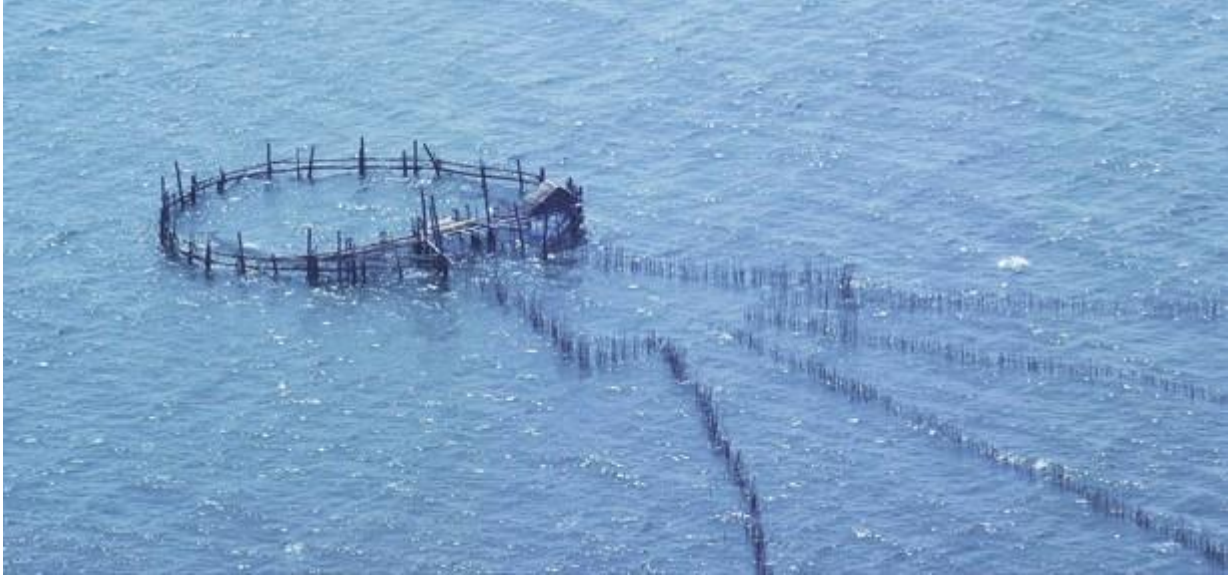
ปิ๊ะแถบบางตะบูน ที่เหมือนรูปการ์ตูนเมื่อเราต้องวาดรูปคนตอนเด็กๆ

ลมยังคงแรงอยู่สม่ำเสมอ เครื่องบินสายมากกว่าทุกๆ ครั้งและมองลงไปก็ยังคงเห็นคลื่นแตกตัวบนผิวน้ำที่วู่วไปขณะนั้น เราใช้เวลาไปเกือบชั่วโมงแล้ว ผมลองให้บินไปทางแหลมผักเบี้ยดูเผื่อว่าจะมีโชคบ้าง.