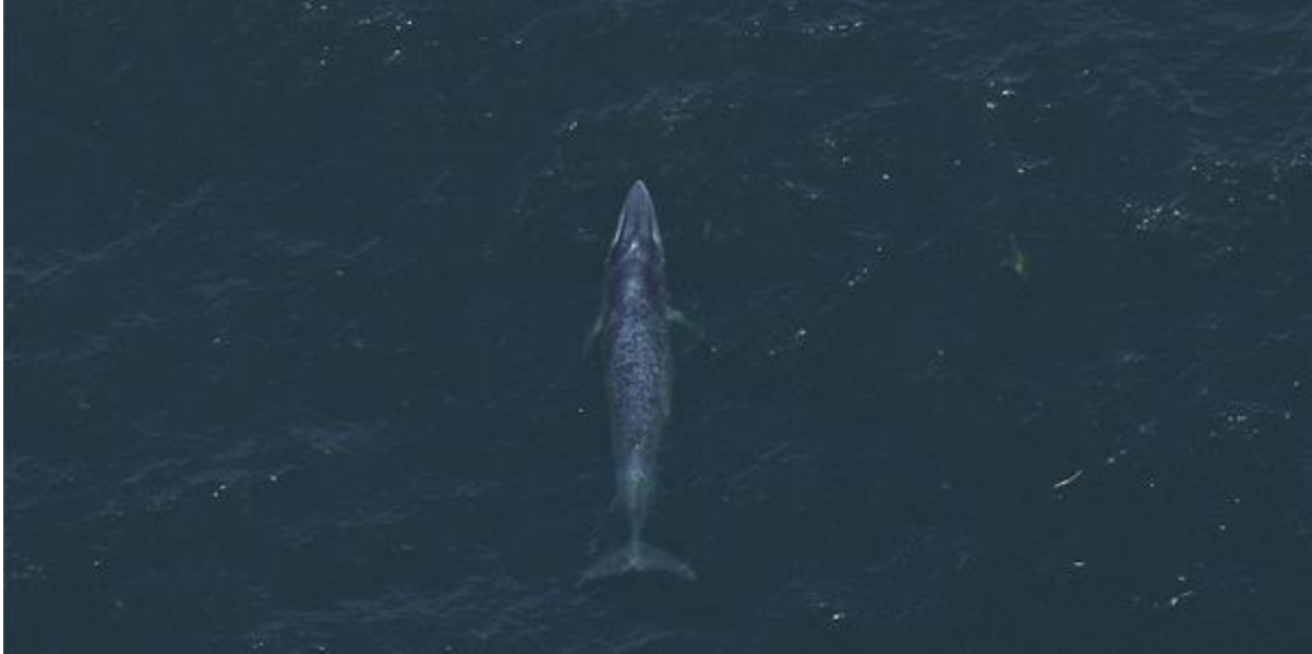
วาฬที่อยู่ลึกจากผิวน้ำไปเล็กน้อยมองผ่านน้ำที่เป็นระลอกเห็นเหมือนท้องเขายื่นกว่าปกติ