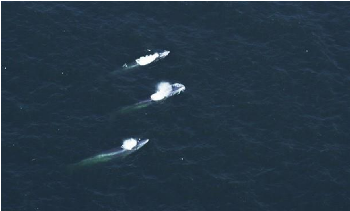
วาฬ 3 ตัวที่ว่ายขึ้นผิวน้ำเกือบๆจะพร้อมๆกันมองเห็นละอองน้ำจากการหายใจเท่าๆกัน