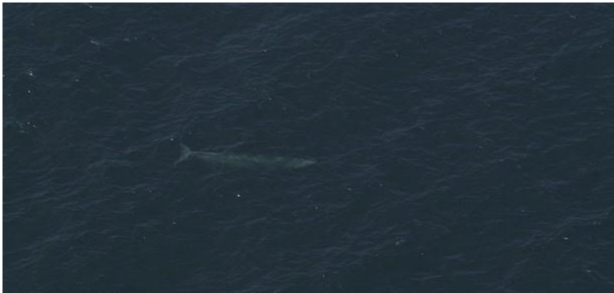
ภาพแรกที่ผมได้เห็นวาฬปรากฏตัวในทวีปนี้ เจียบ,สงบ แต่เต็มไปด้วยความอึดใจ

ผมจำได้ว่าเป็น สองสามวินาที ที่ผมนั่งสงบเพื่อเตือนตัวเองว่า นิ่งไป..ภาพที่ผมมองหา..ใช่ไหม..มันอยู่ตรงหน้าจริงๆ ไม่ใช่ผมสร้างมันขึ้นมาจากความรู้สึกโหยหาไปเองใช่ไหม